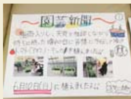
家庭菜園(園芸新聞)