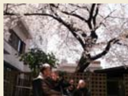
ホームの横にある 桜の木の下でお花見