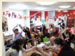
ご家族様と一緒に 行う運動会