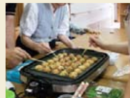
たこ焼きパーティー