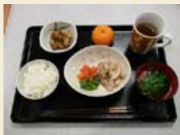
栄養バランスのとれた お食事